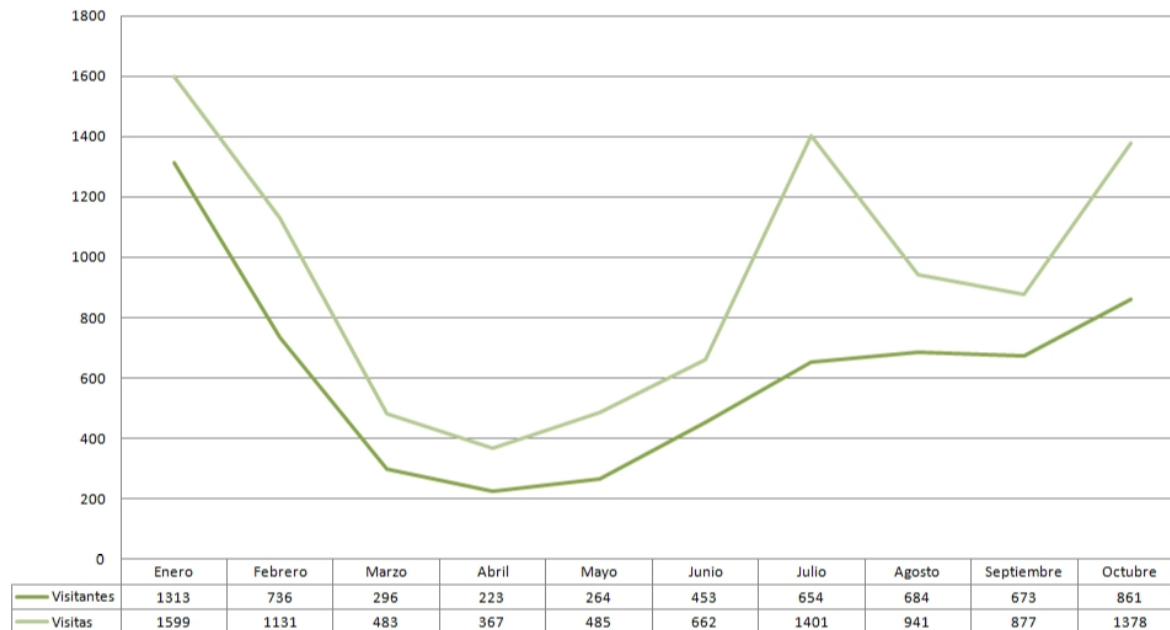
Visitantes y visitas - PEPRI.ES